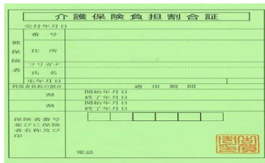
介護保険負担割合証